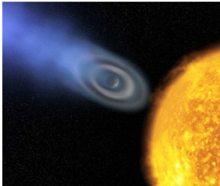
Una impresión artística, muestra una cubierta de oxígeno y de carbono elipsoidal extendida descubierta alrededor del planeta extrasolar HD 209458b.

La ciencia y la tecnología humana para descubrir que el Universo está organizado alrededor de los planetas con vida. Un paso importante en la capacidad de la ciencia humana de descubrir la sociedad planetaria ocurrió el 5 de noviembre de 1999. Científicos en la Universidad de California a Berkeley detectaron un planeta cerca de la estrella HD 209458, en la constelación Pegasus, aproximadamente 153 millones de años de luz (un millón de mil millones millas) de la Tierra.